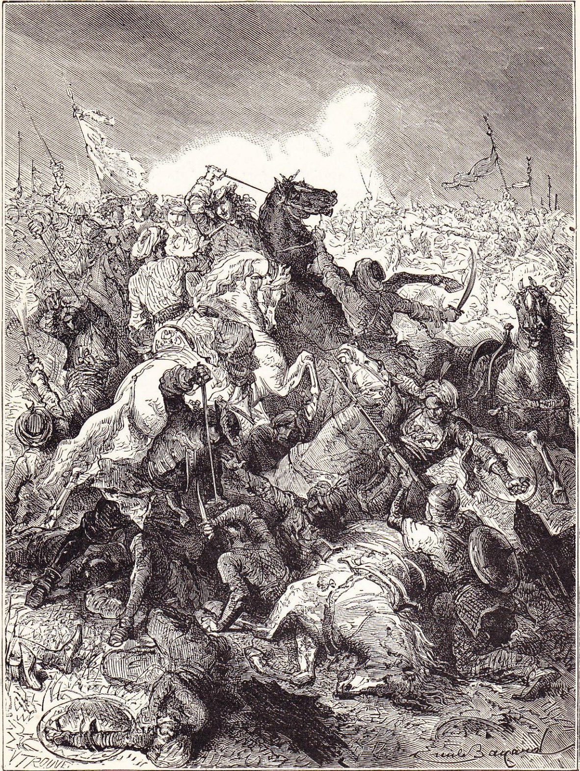
Bataille de Saint-Gothard (1664).